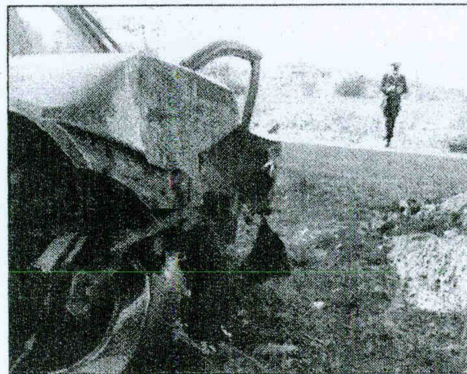
L'incidente sulla Casilina

Malore mentre guida l'auto, poi lo schianto Muore pensionato